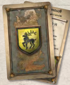
7 карт подготовки вассалов