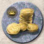
Жетон приказа Железного банка

Железный банк предоставляет займы лордам Вестероса. Благодаря этому вы сможете получить дополнительные отряды или помощь иного рода. Разыграв особый жетон приказа Железного банка (см. «Морские жетоны приказов» на стр. 10), вы можете взять один займ.