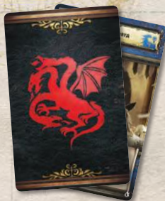
21 карта домов