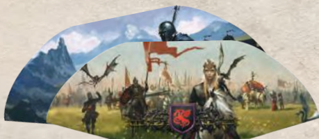
2 ширмы домов