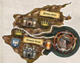
1 накладка Орлиного Гнезда