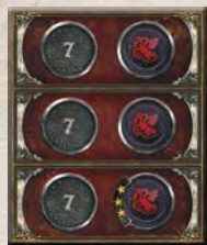
1 пристройка к треку влияния