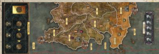
1 дополнительное поле Эссоса