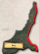
1 накладка Укуса