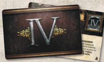
10 карт Вестероса (колода IV)