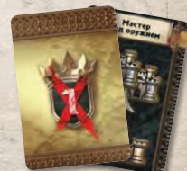
12 карт займов