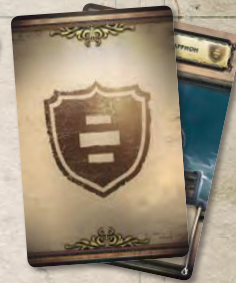
7 карт вассалов