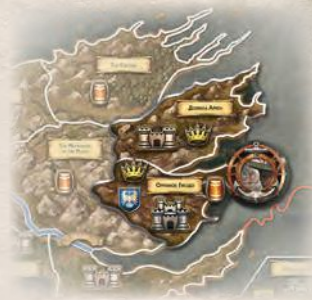
Накладка Орлиного Гнезда

Дом Таргариенов: если дом Таргариенов принимает участие в игре, положите дополнительное поле Эссоса справа от основного и выровняйте оба поля по нижнему краю. В противном случае уберите поле Эссоса в коробку.