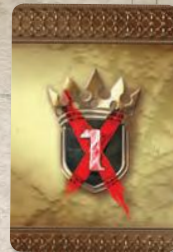
Рубашка карты займа

Не надейтесь, что ушлые банкиры из Браавоса простят вам долг. Получив займ, великий дом должен до конца игры платить ПРОЦЕНТ ПО ЗАЙМУ . В начале фазы Вестероса в порядке хода каждый игрок, имеющий займ, должен сбросить 1 доступный жетон власти за каждую полученную им карту займа. Если у игрока недостаточно жетонов власти на оплату процентов, то за каждый недостающий жетон власти игрок, владеющий Валирийским мечом, выбирает один из отрядов этого игрока в любом месте на поле и уничтожает его. Если игрок, неспособный оплатить процент, и есть владелец Валирийского клинка, то выбор за него делает игрок, занимающий следующую по очерёдности позицию на треке вотчин.