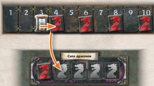
Наступил раунд 4. Сила каждого дракона теперь равна 2

Когда маркер раунда оказывается на делении с жетоном силы драконов, переложите этот жетон с трека раундов на крайнюю левую незанятую ячейку трека силы драконов. С этого момента сила каждого дракона увеличивается на 1.