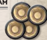
Один набор жетонов приказов вассалам

Положите принадлежащие вассалам жетоны победы рядом с треком Железного трона. Это МАРКЕРЫ ВАССАЛОВ . Затем возьмите наборы из 4 жетонов приказов вассалам по количеству домов вассалов (например, 2 набора, если в игре всего 2 вассала). Один такой набор получает игрок, занимающий первую позицию на треке Железного трона. Ещё один набор — игрок, занимающий следующую позицию, и так далее, пока не закончатся наборы.