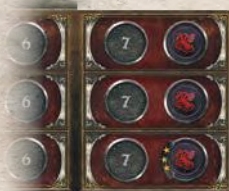
Пристройка к треку влияния

Разложите поле в центре стола. Как показано ниже, положите накладки Укуса и Орлиного Гнезда, а также пристройку к треку влияния.