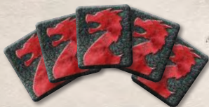
5 жетонов силы драконов